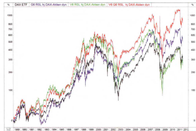
Abbildung 1: Wertentwicklung der grundlegenden Auswahlstrategien im Vergleich zur DAX-Kauf-Halte-Strategie (schwarz)